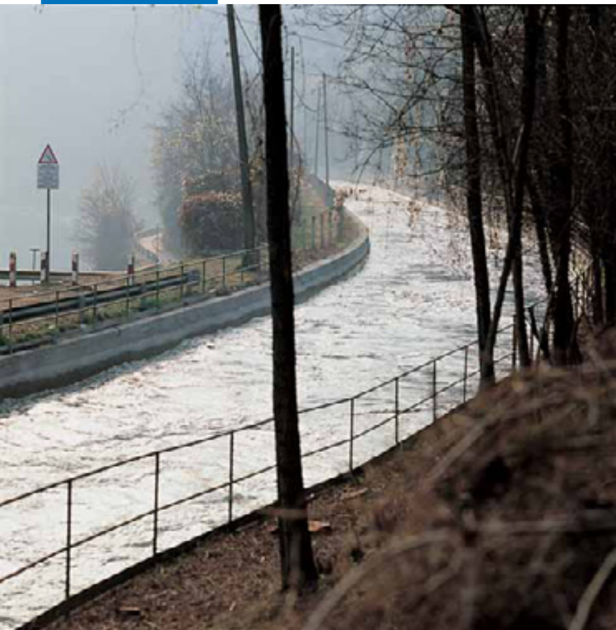
Подводящий канал ГЭС в г. Бертини – Робьяте (Область Комо) с поверхно- стью, обработанной Planiseal 88

Вся необходимая справочная информация по материалу доступна по запросу, а также на сайте www.mapei.com