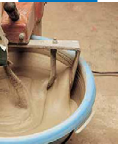
Смешивание серого Planiseal 88 с водой