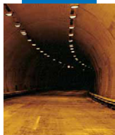
Нанесение белого Planiseal 88 напылением в автодорожной галерее