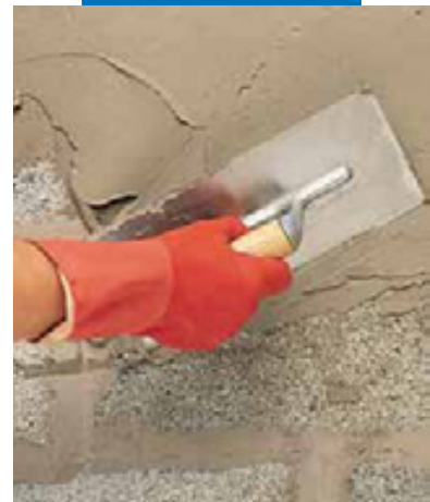
Нанесение Planiseal 88 мастерком