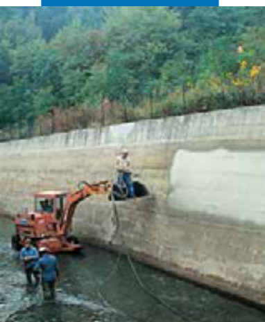
Нанесение Planiseal 88 напылением на подводный канал гидроэлектростанции