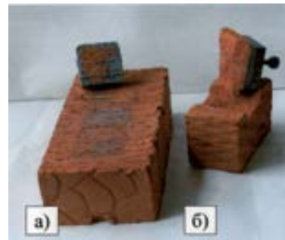
Рис. 3. Характер разрушения при испытании на адгезионную прочность

Следует отметить различный характер разрушения: в первом случае разрушение носит адгезионный характер на 50% поверхности кирпича; во втором случае происходит разрушение по телу кирпича. На рис. 3 и 4 представлены образцы после испытания на адгезионную прочность.