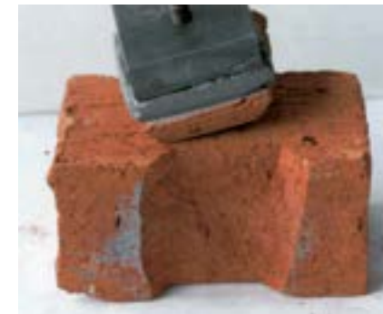
Рис. 4. Разрушение по телу кирпича при испытании на адгезионную прочность