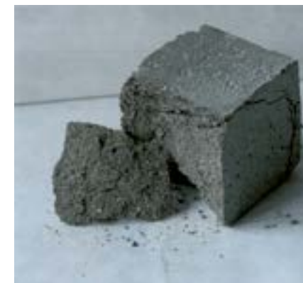
Рис. 2. Характер разрушения образцов при испытании на сжатие после прогрева до 400°C.

Результаты испытаний ремонтного состава на сжатие представлены в таблице 1, потери массы в таблице 2.