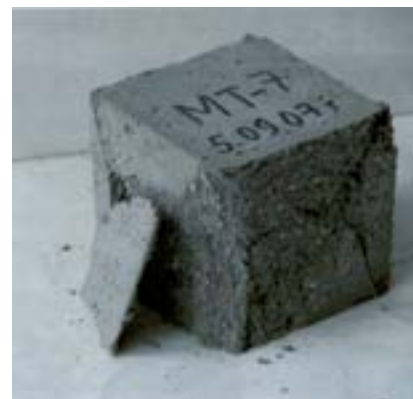
Рис. 1. Характер разрушения образцов при испытании на сжатие.

Общий вид образцов-кубов после испытания на сжатие представлен на рис.1 и рис. 2.